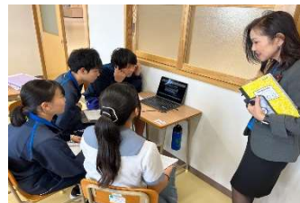
赤嶺教育長も来校しました。