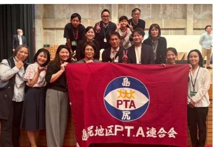
豊崎中・小の PTCA の皆さん