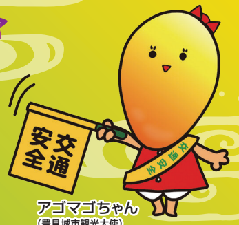
アゴマゴちゃん (豊見城市観光大使)